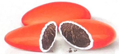
DARK CHOCOLATE DRAGEES

Ingredienti: Zucchero; cioccolato fondente (38%) (zucchero, massa di cacao, burro di cacao, emulsionante: lecitina di SOIA, aromi: vanillina. Cacao min.45%); amido di riso e di mais; gelificanti: maltodestrina, gomma arabica; coloranti: riboflavina - tartrazina* - carminio - rosso allura AC* - carbonato di calcio; agente di rivestimento: cera carnauba; aroma: vanillina. *I coloranti E102 - E129 possono influire negativamente sull'attività e l'attenzione dei bambini. Informazione Allergeni: Contiene soia e derivati; può contenere tracce di glutine, latte, arachidi, frutta a guscio e loro derivati. Conservare il prodotto in luogo fresco e asciutto, lontano dalle fonti di calore e dalla luce diretta del sole. Il lotto ed il termine minimo di conservazione sono riportati sul lato della confezione.