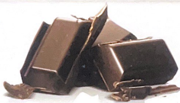
CONFETTI AL CIOCCOLATO FONDENTE